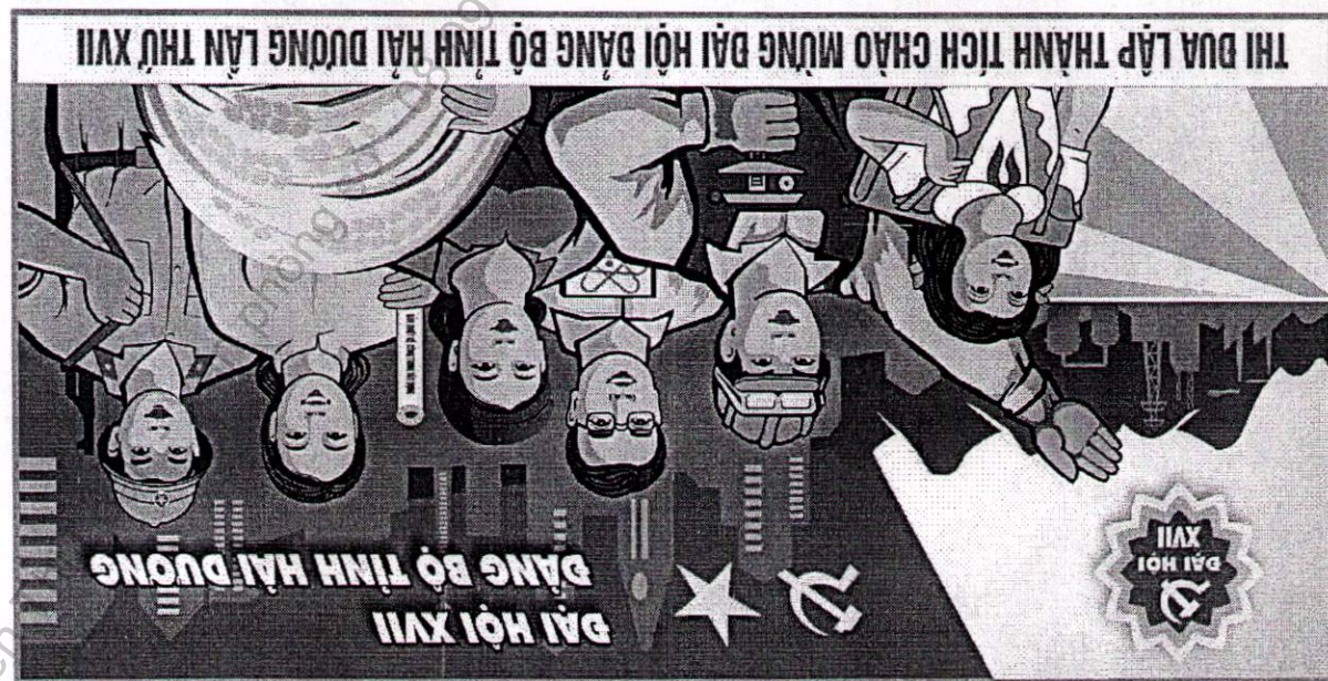
- Mẫu số 3: