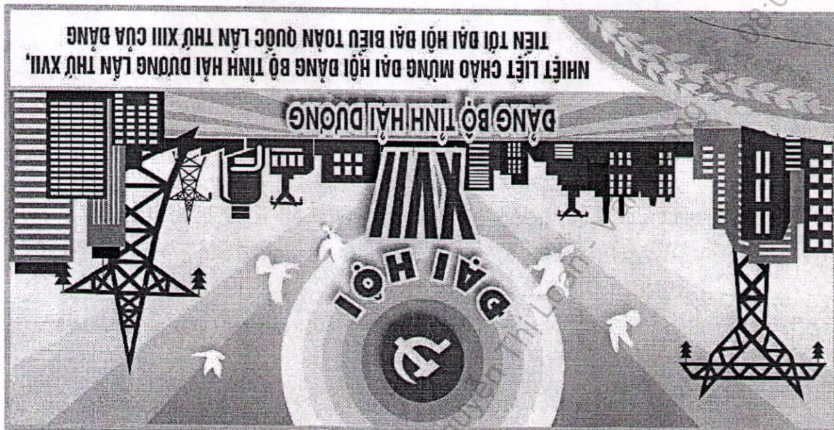
- Mẫu số 4: